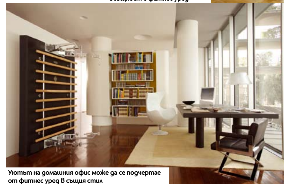
Уютът на домашния офис може да се подчертае от фитнес уред в същия стил

Перфектно тяло от телевизора Последната осма серия на Samsung разполага с безброй приложения, сред които и подобреното Fitness VOD. Там ще откриете десетки клипчета на квалифицирани тренъори по йога, пилатес, кик-бокс и други спортове. Приложението дава възможност да си зададете цели – колко килограма и за колко време искате да свалите – и да следите тяхното изпълнение. Освен това вградената в телевизора камера наблюдава дали правилно изпълнявате упражненията и ви коригира, ако това не е така.