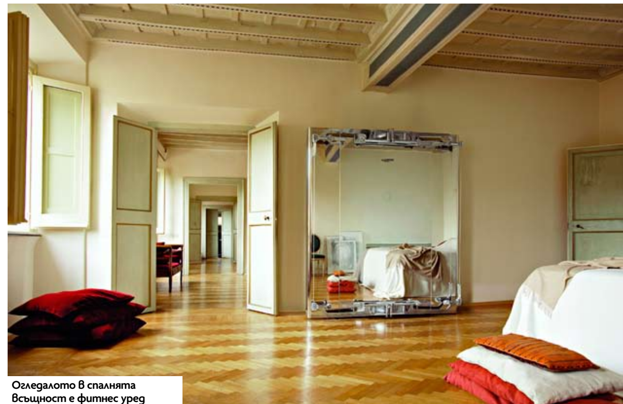
Огледалото в спалнята всъщност е фитнес уред

Една приятелка нарича велоергометъра си „лукозният ми простор“. Друга позната пък всеки ден пренася бягащата си пътека от килера. А аз все още не съм си купила никакъв уред не само защото нямам достатъчно място за него, но и защото не мислех, че си отива с дивана или холната масичка. Досега! Съвременните домашни фитнес уреди са функционални, удобни и най-вече стилни. До такава степен, че няма и да ви хрумне да ги скриете някъде.