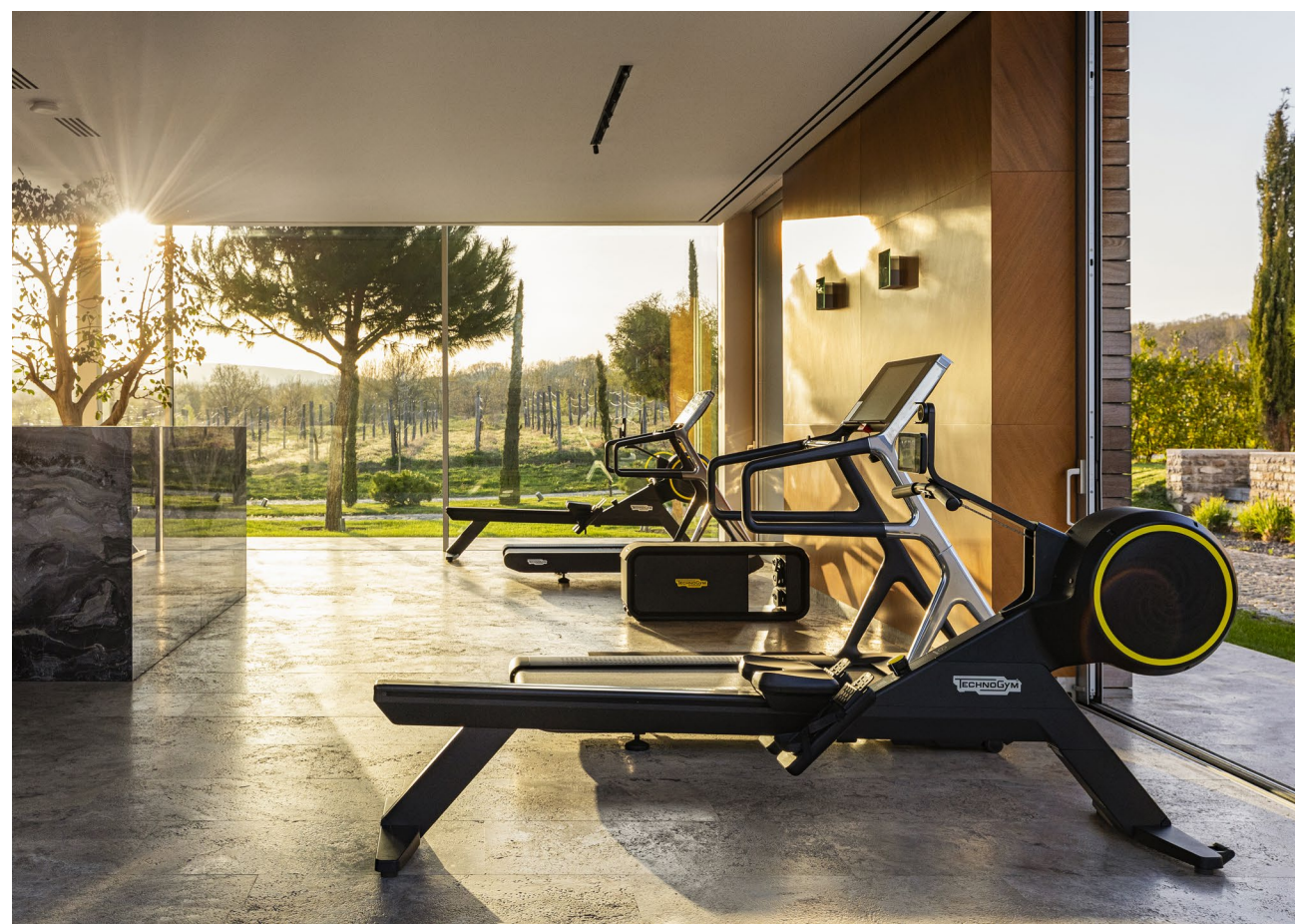
Vaya Beach Resort